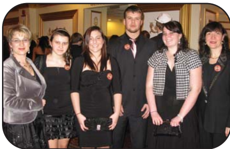
Szkoła im. Kalinowskiego ZPRKA na studniówce.

W sobotę, 13 lutego w godzinach wieczornych odbyła się "Studniówka 2010". "Studniówka" to pierwszy poważny bal w życiu młodzieży, który na zawsze pozostaje w pamięci. Na tej imprezie nasza młodzież reprezentująca 31 polonijnych szkół sobotnich z Chicago i jego przedmieść oraz z Munster, IN, bawiła się wspólnie z nauczycielami, opiekunami oraz zaproszonymi gośćmi. Studniówka została zorganizowana przez Zrzeszenie Nauczycieli Polskich w Ameryce i Szkołę im. Ignacego Paderewskiego z Niles. W tym roku około 700 uczniów przystąpi do matury, niektórzy już pod koniec kwietnia, inni na początku maja. Po oficjalnych przemówieniach, w których ja także wzięłam udział i po smacznej kolacji, rozpoczął się bal tradycyjnym polonezem. Miło było spoglądać na wypełnioną po brzegi salę, która tętniła radością. Trudno było oderwać wzrok od tańczących w rytm swoich ulubionych przebojów zadowolonych studniówkowiczów.