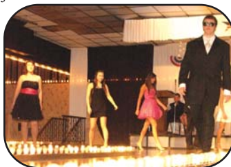
Dorośli i młodzież biorąca udział w pokazie mody.