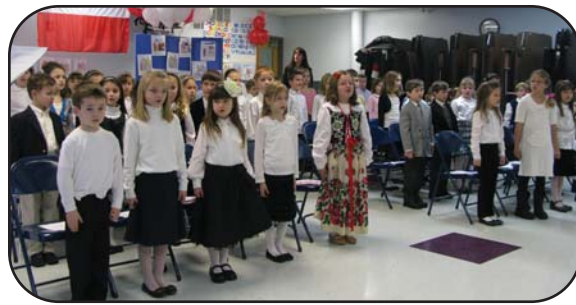
Pierwszoklasiści w Polskiej Szkole Jana Pawła II.

Nasi młodzi tancerze w barwnych ludowych strojach zachwycili widownię swoimi imponującymi tańcami, a publiczność nagrodziła